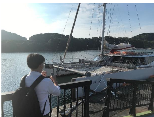
九十九島パールシーリゾートのクルーズ 「99TIRTON」

引き続きアフターコロナの誘客に向け、こうした事業に積極的に取り組んでまいります。