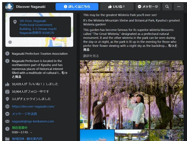
長崎県観光連盟公式 Facebook（英語版）での投稿画面