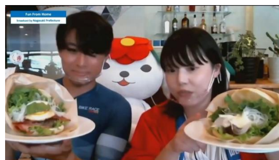
ライブ配信の様子