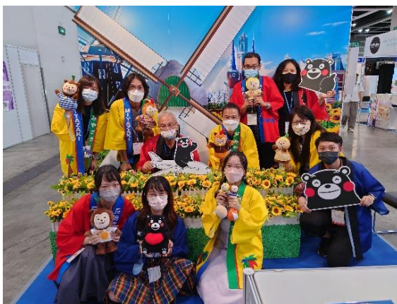
長崎県ブースで熊本・宮崎スタッフと撮影

香港では、8月12日（金）から入国者に対する隔離期間が7日間から3日間に短縮されるなど緩和に向けた動きがみられることから、より積極的なプロモーション等を行うなど、誘客活動に取り組んでまいります。