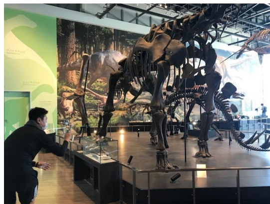
長崎市恐竜博物館