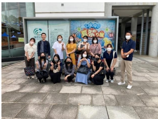
海きらら視察の様子

参加したハナツアーの関係者は、各施設で積極的な質問や多くの写真を撮影され、「ビザ解禁後の個人旅行への仕掛けを早めに準備する」という声も聞かれました。