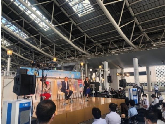
大石知事・長濱氏のトークショーの様子