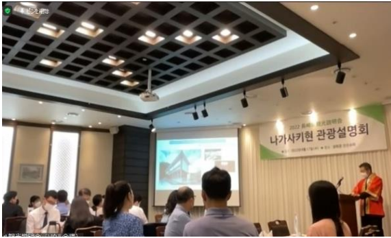
観光説明会の様子（ソウル）