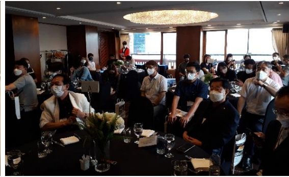
観光説明会の様子（釜山）