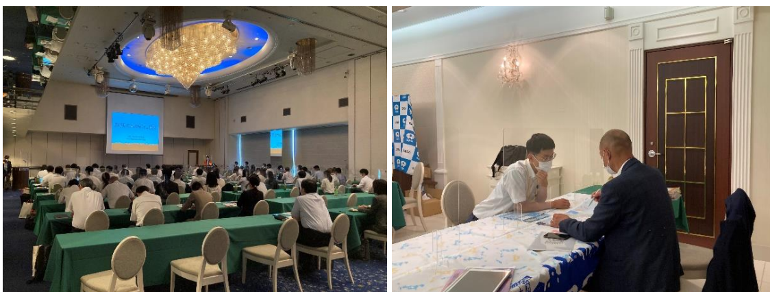
説明会・相談会の様子

その後の相談会では、同機構の会員である長崎市や佐世保市、雲仙市とともに、各学校のニーズに合うプログラムの紹介や県外の学校の情報収集を行いました。また、これまで接点のなかった旅行会社にもブースを訪問いただき、長崎のアピールに努めました。