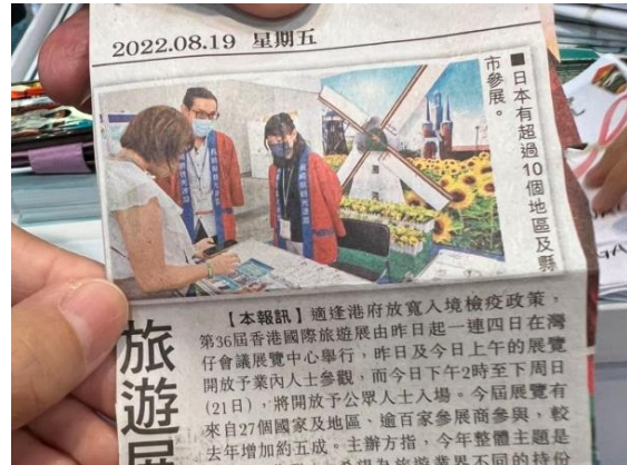
香港現地の新聞記事掲載