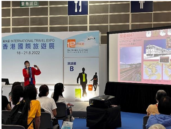
長崎県観光セミナーの様子