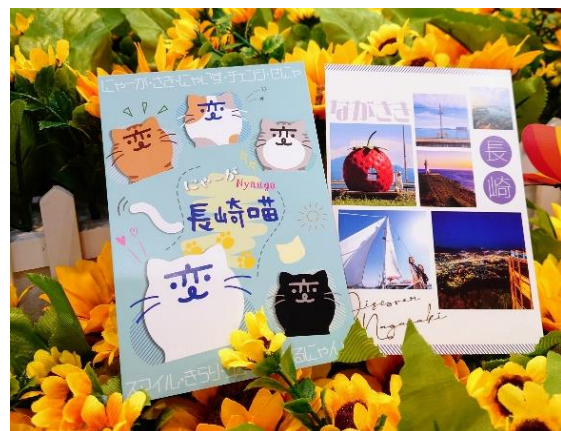
好評だった「にゃーが」ポストカード