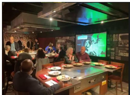
ディナーセミナーの様子2