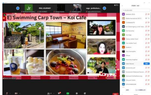
長崎県を紹介している様子

当連盟としては引き続き、アフターコロナの観光市場の変化に応じ、現地エージェント等へ関連する情報やコンテンツを積極的に紹介してまいります。