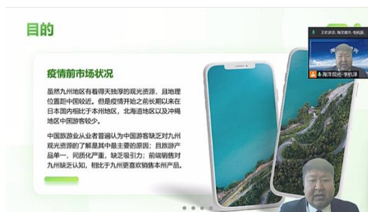
発表会の様子（事業紹介）

当連盟としては引き続き、アフターコロナの観光市場の変化に応じ、現地エージェント等に対し、関連する情報提供や商品造成へのアプローチなど積極的に進めてまいります。