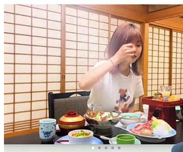
発表会の様子（動画版行程の放映）