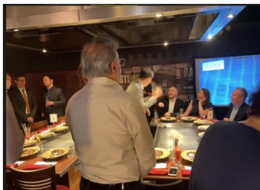
ディナーセミナーの様子1

今後も、引続き九州各県と連携しながら、コロナ収束後の誘客につながる取組を実施してまいります。