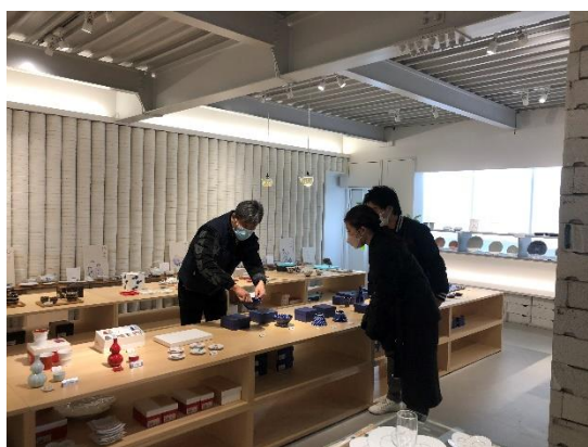
撮影風景（OYANE@波佐見町）