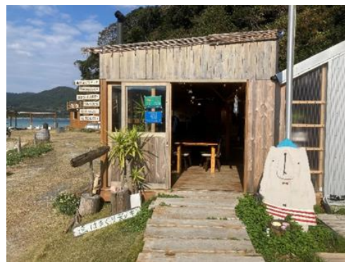
蛤浜海水浴場 (はまぐりデッキ @上五島)