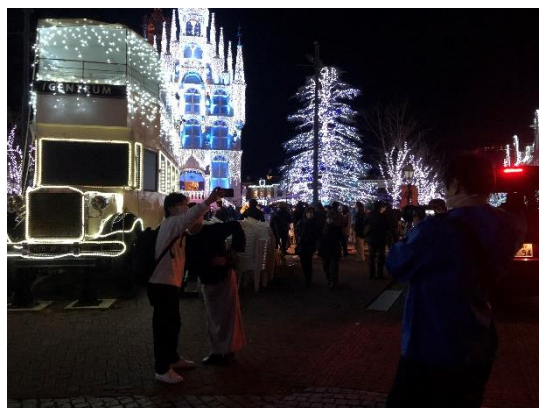
撮影風景（ハウステンボス@佐世保市）