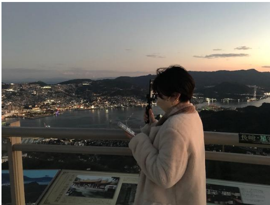
長崎夜景（稲佐山展望台）

ライブ配信の動画はアーカイブに常に残っているため、長期間に渡ってのフォローのエンゲージメント向上や長崎県の知名度向上が期待されます。