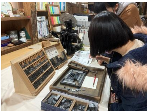
活版印刷体験 (OJIKAPPAN @小値賀町)

今後は、定番の観光スポットを紹介するに留まらず、訪日旅行でリピーターの多い繁体字圏の方々がまだ知らないコンテンツ等を紹介し、繁体字圏のユーザーへの接触機会を増やしつつ、旅先として本県を選んでいただけるよう、さらなるプロモーションの充実を図ってまいります。