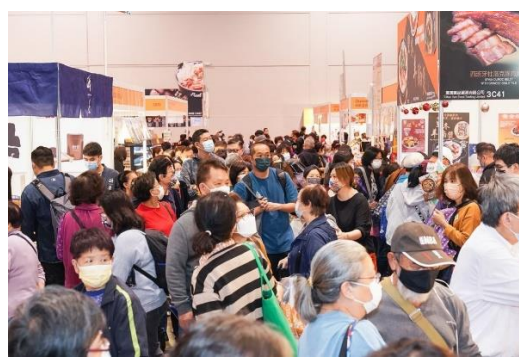
Hong Kong Food Festival 2021 @香港コンベンション&エキシビジョンセンター