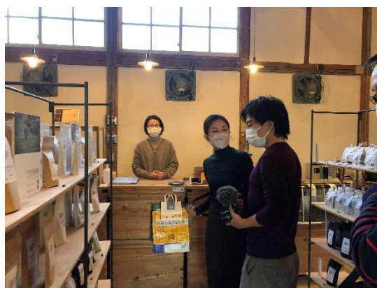
撮影風景（Sorriso riso@東彼杵町）