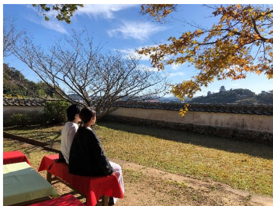
撮影風景（閑雲亭@平戸市）