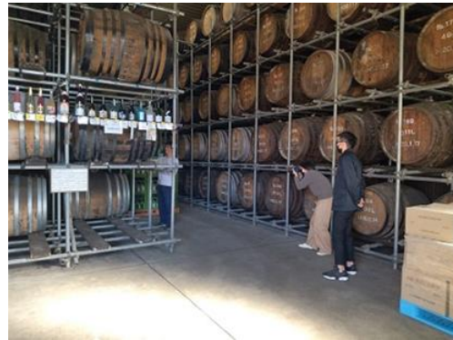
酒蔵の紹介 (壱岐の蔵酒造 @壱岐市)