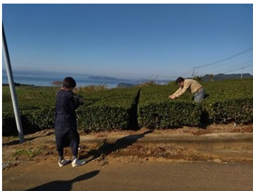
そのぎ茶の茶畑 (西海園 @東彼杵町)