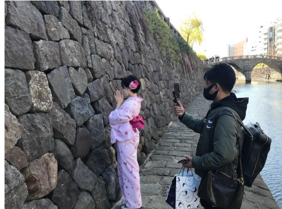
着物で町歩き（眼鏡橋）