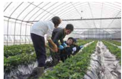
①いちごの手入れ作業