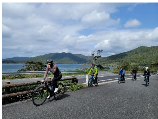
五島でのサイクリング

ATについては、コースに係る事業者同士の連携、ツアー販売の土台作りが必須であるため、地元や九州観光機構等と連携し販売に向けたセールス及びプロモーションを行ってまいります。