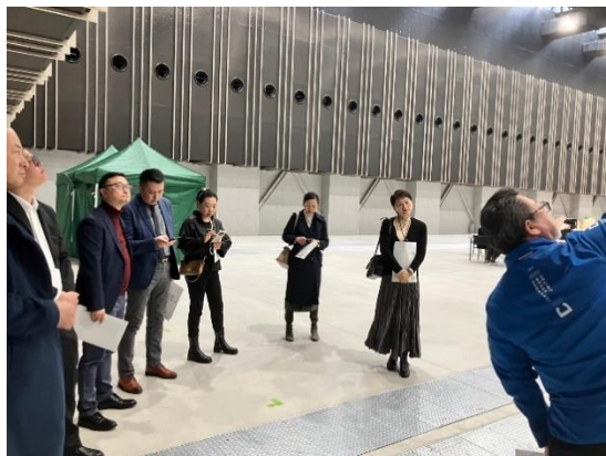
上海MICE協会 出島メッセを視察