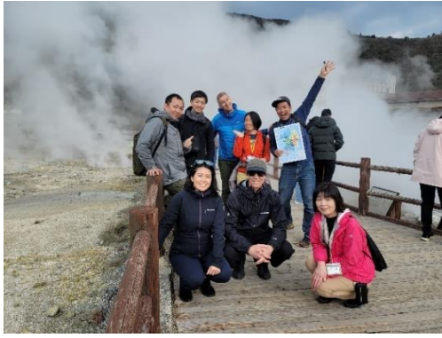
雲仙コース イン트로ダクション