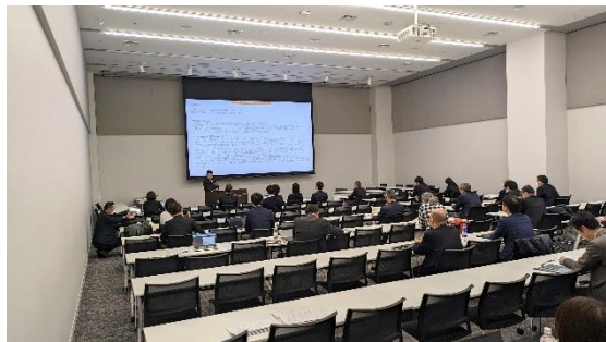
インバウンド向けキャッシュレス決済導入促進セミナー会場の様子