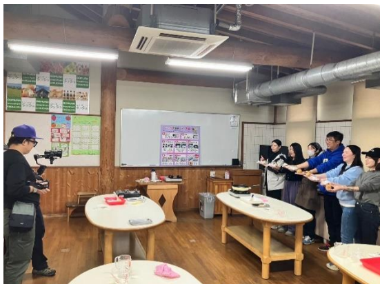
雲南省の旅行社・メディア おおむら夢ファームシュシュにて いちご大福作り体験

当連盟は、今後とも中国東方航空の長崎～上海路線の利用促進を意識し、現地旅行社との連携を取りながら、本県の認知度を高めるとともに、長崎県内の宿泊を含む旅行商品の造成支援と販促に努めてまいります。