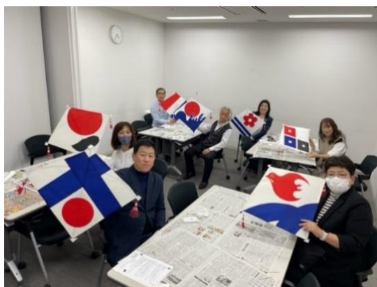
長崎ハタ作り体験

当連盟では、このような視察研修を継続して実施し、教育旅行誘致に積極的に努めてまいります。