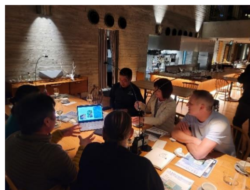
関係者同士の意見交換