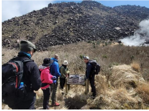
雲仙コース 普賢岳トレッキング