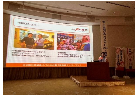
各地区の取り組み事例の報告