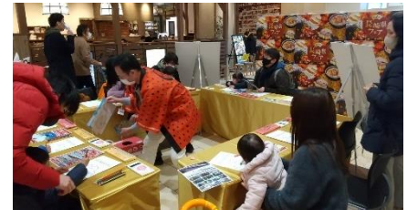
物販・ランタンフェスティバル装飾・ワークショップコーナーの様子