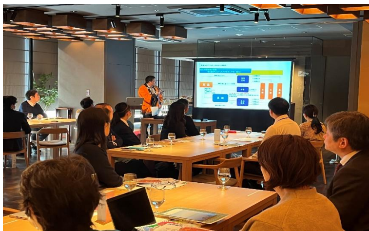
「坐来大分」での説明会の様子

今後、各種媒体への掲載が予定されており、関東エリアからの誘客効果につながる新たな取り組みとして期待できるイベントになりました。引き続き、九州横断3県ルートが新たなゴールデンルートとして認知されるよう取り組んでまいります。