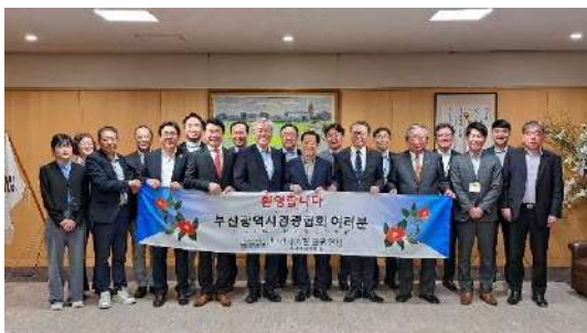
知事表敬集合写真

11月28日(火)、釜山広域市観光協会創立60周年及び第50回観光の日記念行事が予定されており、当連盟も招待され出席する予定としております。引き続き、釜山広域市観光協会との良い関係性を継続し、誘客に努めてまいります。