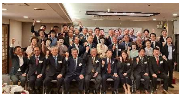
歓迎レセプション集合写真