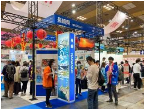
長崎県ブースの様子