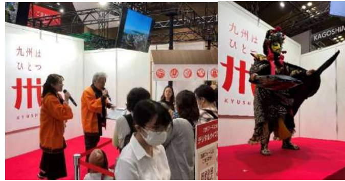
本県をPRする観光連盟スタッフと変面