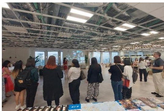
旅行社向け商談会の様子