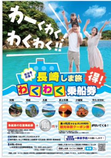
わくわく乗船券ポスター