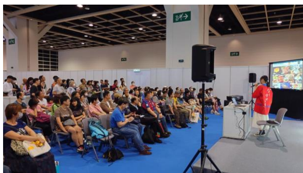
観光セミナーの様子