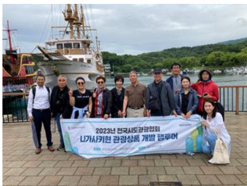
西海パールシーリゾート

一行は、佐世保のゴルフ場を視察された後、パールシーリゾートや生月島、川内峠、平戸城などを視察されました。アウトバウンド事業部の委員長自身も旅行会社を経営されており、今後の本県旅行商品の造成と送客を期待するとともに、韓国各地の観光協会に対して横展開していただくよう、引き続き働きかけてまいります。