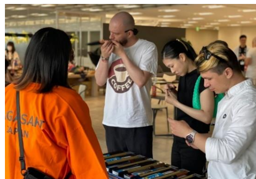
一般向けイベントの様子