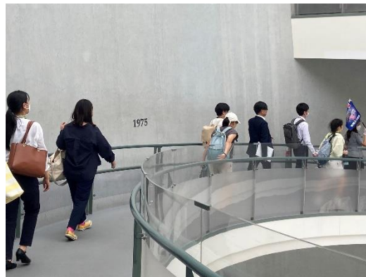
長崎原爆資料館見学